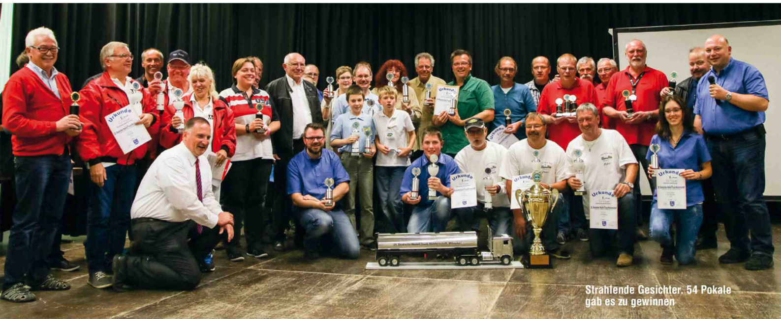
Strahlende Gesichter. 54 Pokale gab es zu gewinnen