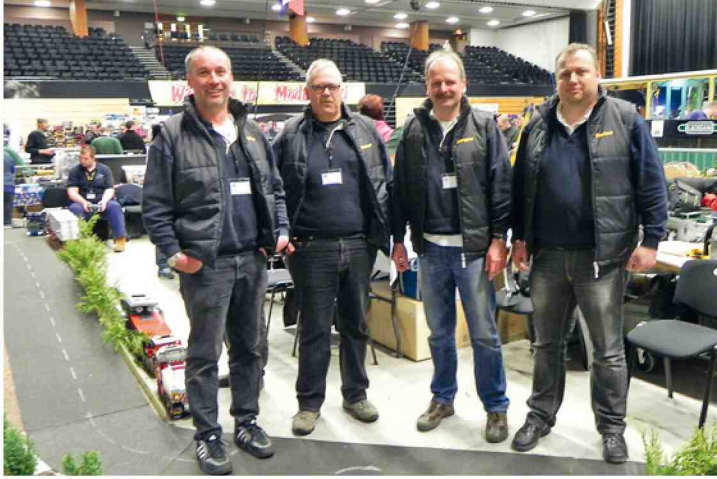
Das Organisationsteam der DM 2014