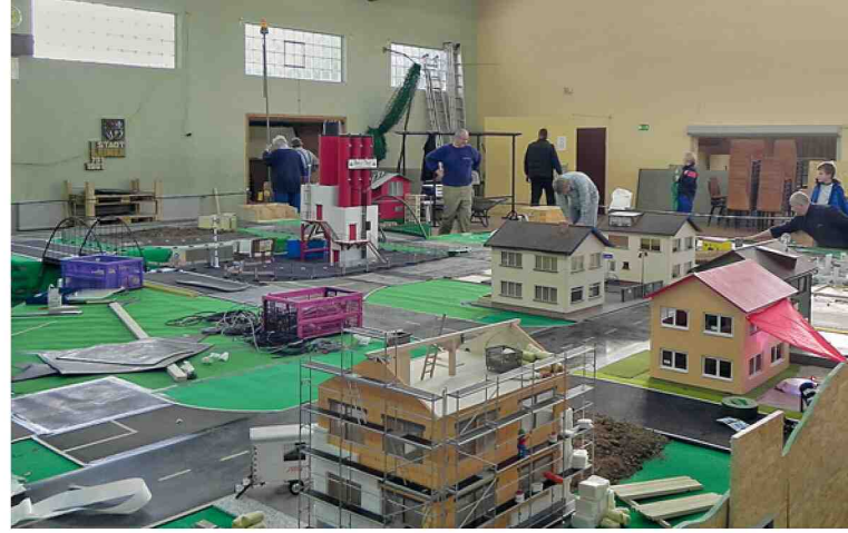
In der Halle des FMT Kurpfalz findet alljährlich ein Modelltrucktreffen statt; für eine Deutsche Meisterschaft ist die Halle aber zu klein