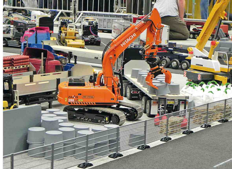
... oder so, wenn es um Geschicklichkeit geht

„gespielt“ werden und es können zusätzliche Aktionen im Wettbewerbsstil ausgeführt werden, zum Beispiel ein Belade- und Transportwettbewerb. Hier sind verschiedene Möglichkeiten in Planung, für konkrete Aussagen ist es im Moment aber noch zu früh.