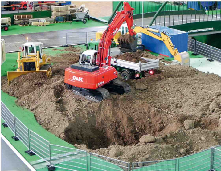
So könnte einer der geplanten Wettbewerbe mit einer Belade- und Transportaufgabe aussehen ...