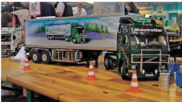
Passende Lackierung für einen Truck aus der Lüneburger Heide