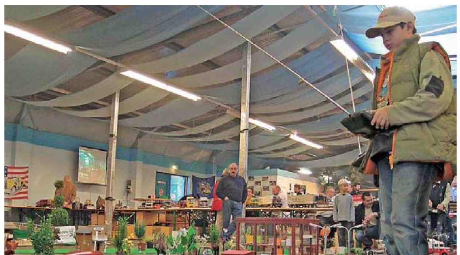
Auch das freie Fahren darf auf einer DM natürlich nicht zu kurz kommen