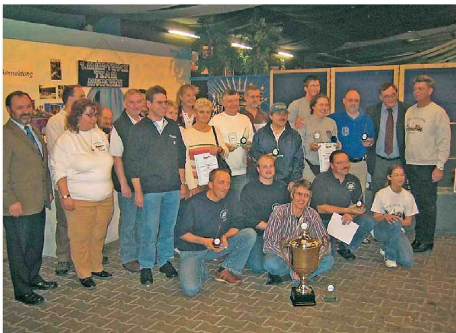
▲ Strahlende Gewinner in allen Klassen