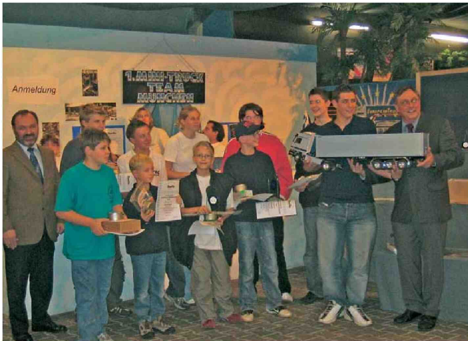
Die Sieger des Junior Supercup