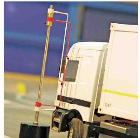
Hier geht's um Millimeter!