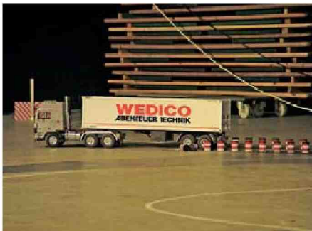
Schwierige Übung: Rückwärts Einparken