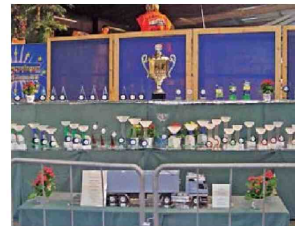
Lohn der Mühen: Tolle Pokale aus Glas